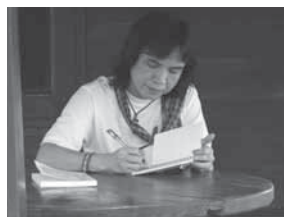
สลก คุณวุฒิ

กลุ่มเริ่มต้นจากไม่กี่คน แต่เมื่อได้ยินถึงหูคนอื่น ๆ ที่มีความสนใจอยู่แล้ว กลุ่มลำนำมูลก็ขยายสมาชิกเพิ่มขึ้น เพราะทุกคนล้วนอยากมีเพื่อนพูดคุย จนเป็นกลุ่มใหญ่ และรู้ถึงหน้าที่เขียนส่วนกลาง ชาวการเกิดกลุ่มวรรณกรรมลำนำมูลก็ปรากฏต่อแวดวงวรรณกรรมไทย สมาชิกเกือบสามสิบคนจึงมีตัวตนที่ชัดเจนยิ่งขึ้น