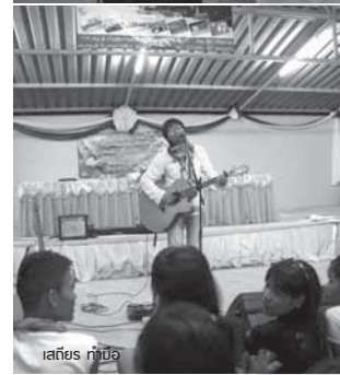
เสถียร ทำมือ