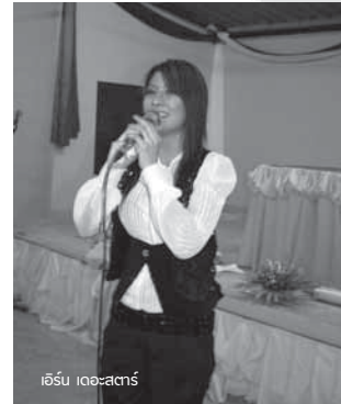
เอิร์น เดอะสตาร์

ค่ายล่าสุด ซึ่งเป็นค่ายที่ 29 นี้ทางทีมงานได้มาจัดกันที่พีเอสแคมป์ ของจังหวัดนครราชสีมา และเอิร์น เดอะสตาร์ เดินสายเปิดคอนเสิร์ตที่จังหวัดน้พอดี จึงได้มาร่วมร้องเพลงให้เด็ก ฟัง ต่อมาอีกคืน เสถียร ทำมือ ซึ่งก่อนหน้านั้นักจะเป็น