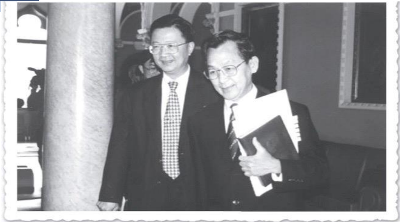
▲ ประชุมคณะกรรมการปฏิรูประบบสุขภาพแห่งชาติ (คปรส.) (๒๕๔๓)