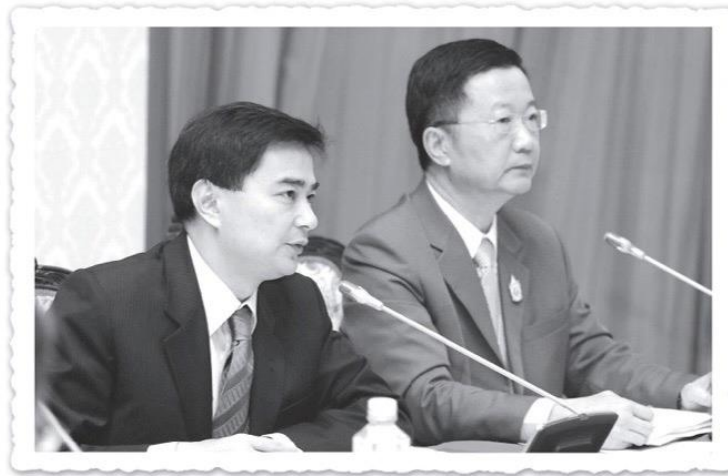
▲ ประชุม คสช. ที่ทำเนียบรัฐบาล (๒๕๕๒)