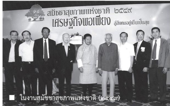
■ ในงานสัปดาห์สุขภาพแห่งชาติ (๒๕๕๙)