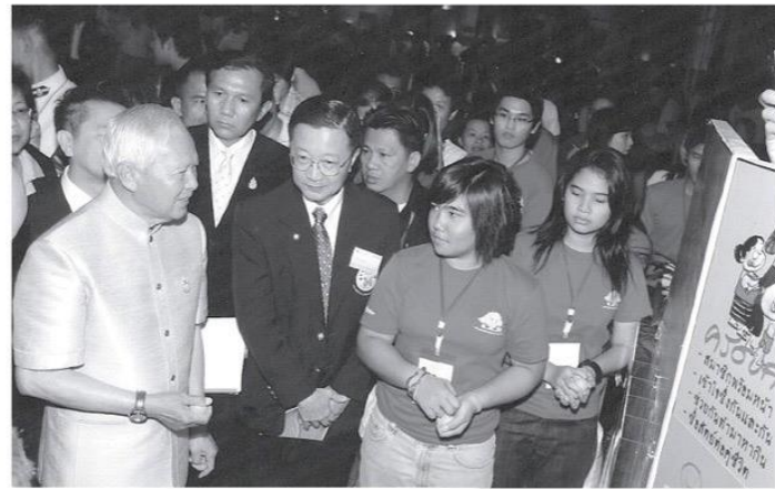
▲ ประธานองคมนตรีและรัฐบุรุษ (พลเอกเปรม ติณสูลานนท์) (๒๕๕๙)